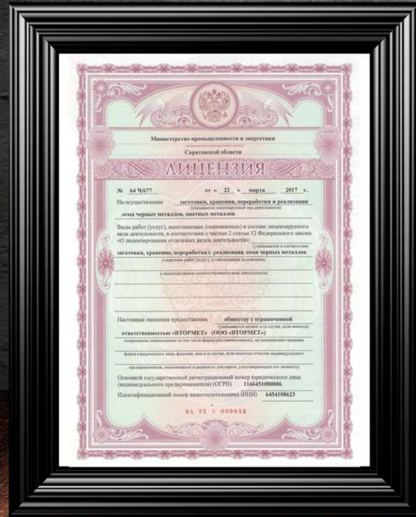
Лицензия чермет № 64Ч/677